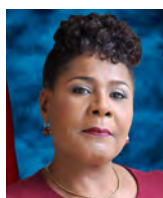
Paula-Mae Weekes antigua Presidenta de Trinidad y Tabago