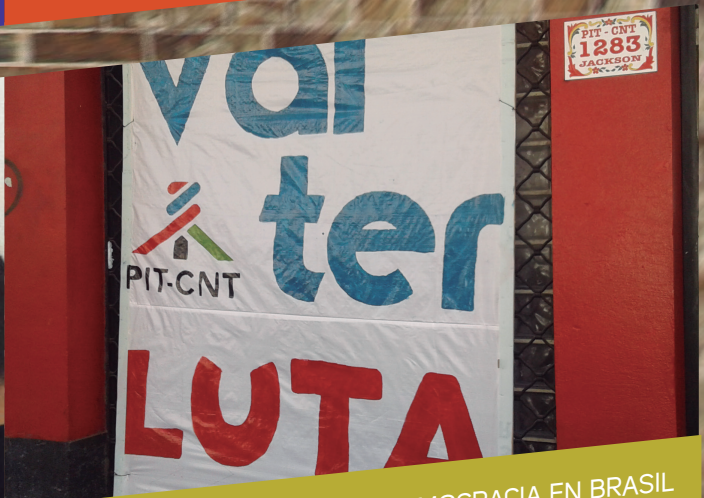
PIT CNT ,DEFENSA DE LA DEMOCRACIA EN BRASIL