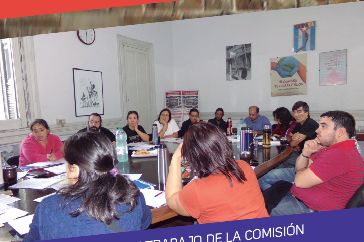
INSTANCIA DE TRABAJO DE LA COMISIÓN NACIONAL DE SALUD LABORAL

EL VIERNES 15 DE ABRIL SE REUNIÓ EL FRENTE DE AUTOCONSTRUCCIÓN, ATENTO A LO ESTABLECIDO EN NUESTRO XV CONGRESO COMENZAMOS A AFIANZAR ESTA MODALIDAD DE TRABAJO. INTEGRAN SECRETARÍAS DE FINANZAS, ORGANIZACIÓN Y PRENSA Y PROPAGANDA.