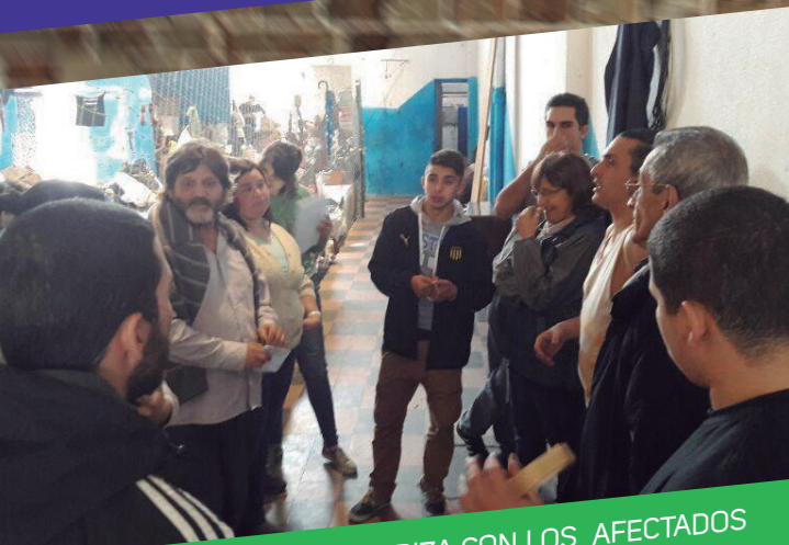
FENAPES SE SOLIDARIZA CON LOS AFECTADOS POR LAS INCLEMENCIAS DEL TIEMPO