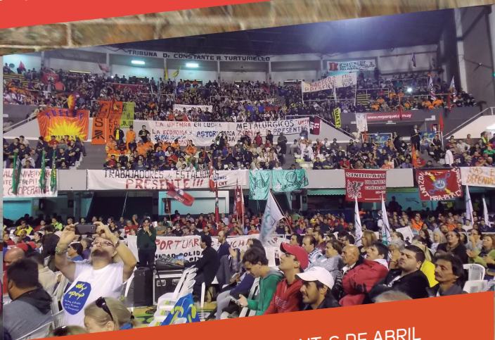
PARO PARCIAL DEL PIT CNT, 6 DE ABRIL