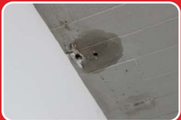
TECHOS QUE SE LLUEVEN