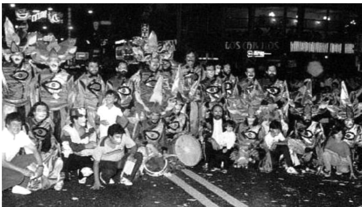
FALTA y RESTO, 1987

10- Por último, debemos sostener que lo mejor para un uruguayo, en la tierra de Artigas, Varela y Figari, sigue siendo pasar por la Educación Pública porque es el único lugar donde verá la sociedad en la que vive y se le educará para cualquier futuro posible.