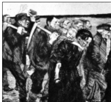
The March of the weavers in Berlin, 1897 de Käthe Kollwitz, figura destacada del realismo crítico.

Sí, sin dudarle un segundo. Sin ceder al imperio del comercio y la exacerbación del deseo consumista en forma de regalos y saludos “por ser mujeres”. Como mujeres y hombres trabajadoras/es, y en especial como trabajadoras/es DOCENTES, necesitamos clarificar conceptos. Las fechas importan: